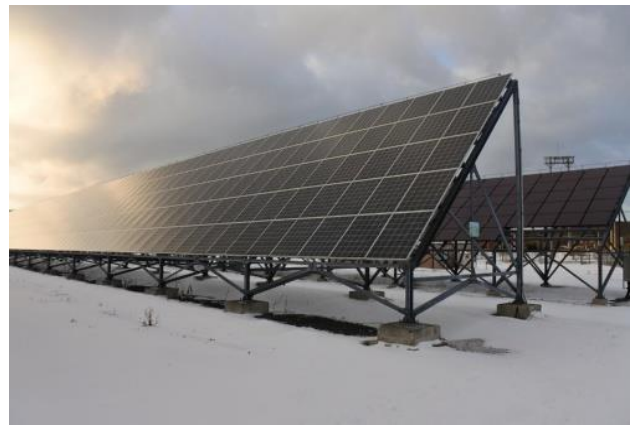
(稚内太陽光発電所)

✚ 交通は羽田空港から約 80 分と稚内空港からはレンタカーで 1 時間少しとなっており、全体的には便利性も良好となります。地元、浜頓別町市街地からも車で 15～20 分位となり、現地場所は茂字津内 2506 の他 36 筆に分筆されています。小学校、中学校もある、かなり大きな町であり、中心部からは歩いても 20-30 分、車ですと 5 分もかかりません。和田牧場（元：